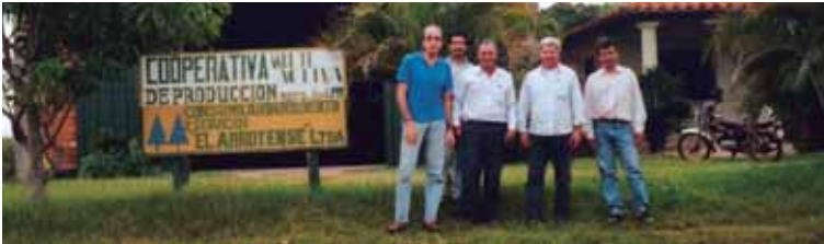
Visita del comitato progetti Ctm alromercato alla cooperativa

Anche grazie al prezzo riconosciuto dal commercio equo, la cooperativa è in grado di distribuire ai soci il prodotto al prezzo di costo.